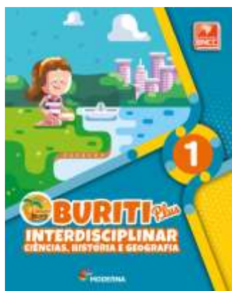
NATUREZA E SOCIEDADE