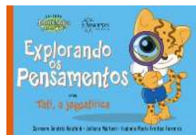
ALFABETIZAÇÃO EMOCIONAL 2º SEMESTRE