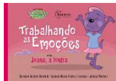
ALFABETIZAÇÃO EMOCIONAL 1º SEMESTRE